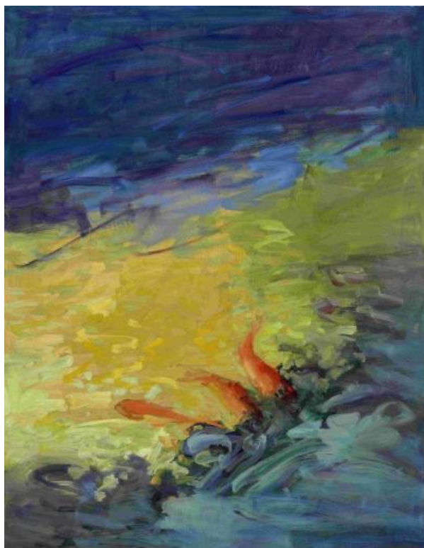
Carpes Koi 01

2015, Rêves colorés , Galerie Le Soleil sur la Place 2010, Un pas plus loin , Galerie Le Soleil sur la Place 2002, Femmes , Galerie Le Soleil sur la Place